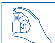
2. 上図のように容器を持ってください